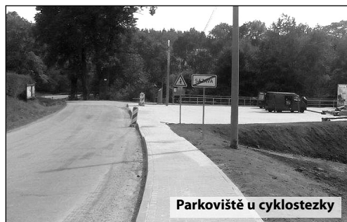
Parkoviště u cyklostezky