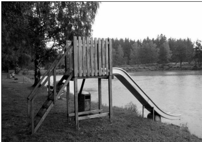
Manželé Janáčkoví, kteří provozují přírodní koupaliště, zde nechali instalovat dětskou skluzavku do vody a k dispozici jsou zde také dvě šlapadla.