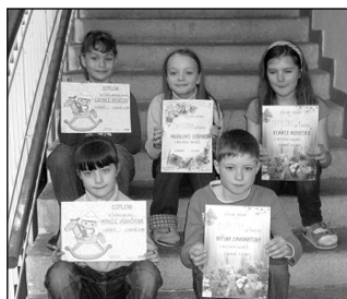
Žáci, kteří se umístili na prvních místech