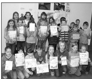
Soutěžící v recitační soutěži