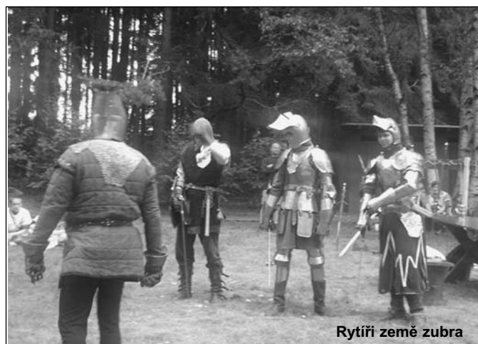
Rytíři země zubra

Nezbývá proto než se těšit na příští ročník a přát si, aby pořadatelům více přálo počasí.