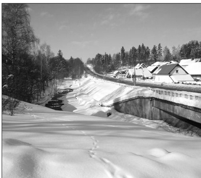
Zima jak má být, únor 2006

Na základě oznámení Ministerstva dopravy upozorňujeme na nutnost výměny řidičských průkazů vydaných od 1.července 1964 do 31.prosince 1993. Bližší informace naleznete na úřední desce obecního úřadu, případně na dopravně správních agendách Městského úřadu Žďár nad Sázavou. Ke konci roku mohou být z provozních důvodů výměny řidičských průkazů spojeny s velmi dlouhým čekáním ve frontách na úřadech.