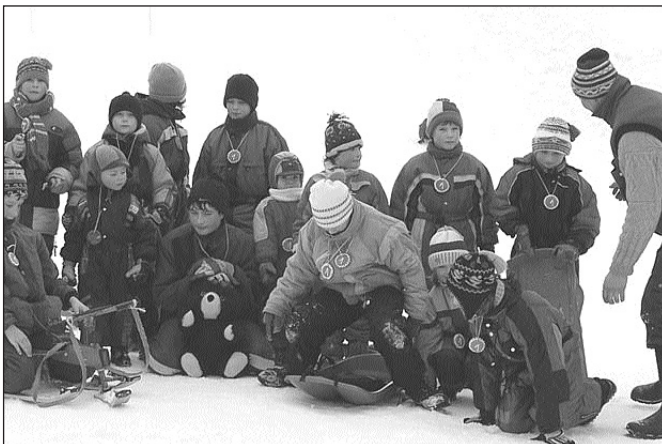
Perníkovou medailí si zaslouží všichni