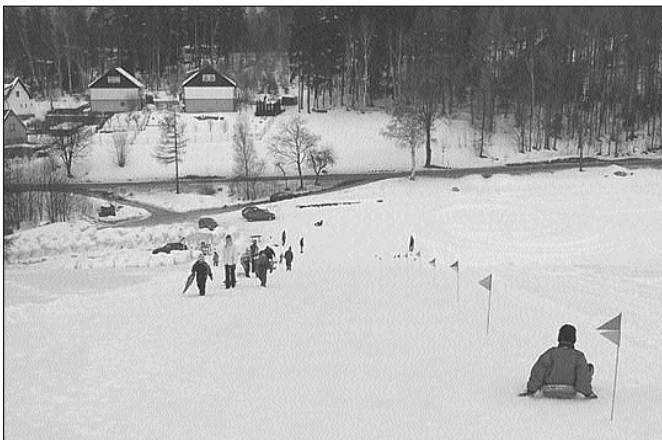
Na upraveném kopci u Lacinových v horní Sázavě se zase schází děti, které rády jezdí na lyžích, sáňkách, bobech a třeba i na traktorové duši. Svah je díky panu Lacinovi perfektně upraven a rodiče zde pro děti (a nejen pro ně) společně pořádají různé závody. Díky všem, kteří svůj volný čas takto dětem věnují.