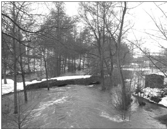
Kamenný most v dolní Sázavě

V naší obci má také na starém kamenném mostě v dolní Sázavě umístěno měřící zařízení Český hydrometeorologický ústav. Bohužel spolupráce s tímto ústavem v podstatě neexistuje