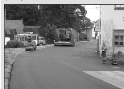
Opravy místních komunikací před Starým hostincem

27. a 28. července provedla firma COLAS část plánovaných oprav místních komunikací - u kapličky, u hostince a za hostincem u Kociánových. Náklady činily 520.000Kč a byla tak již odstraněna větší část následků lokálních záplav, které proběhly více než před rokem. Nyní již zbývá pouze dokončit odvodňovací rigol nad starou tratí (současně se stavbou opěrné zdi v dolní Sázavě).