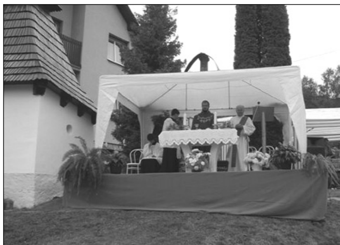
Bohoslužba u kapličky