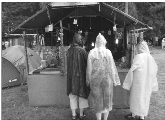
Keltské slavnosti na koupališti