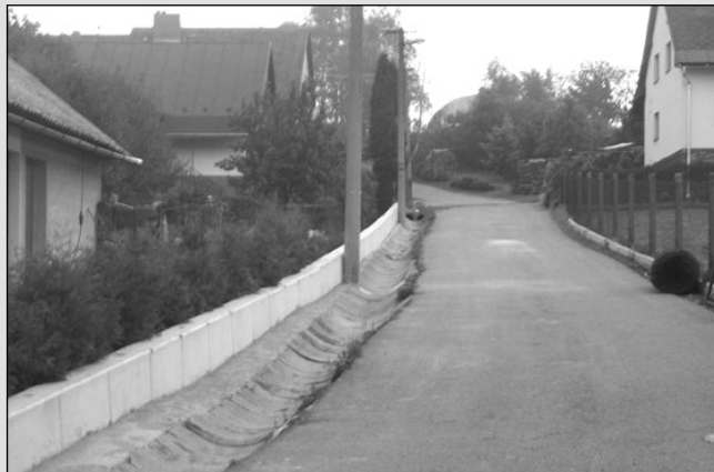
Ochranná zídka proti vodě z přívalových dešťů