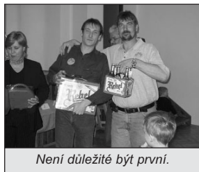
Není důležité být první.