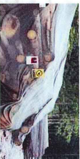
Ochrana skládek pomocí insekticidních sítí.

Asanační metoda odvozem napadeného dříví z lesa byla zavedena v 80. letech, kdy následovalo v průběhu několika dní zpracování jehož součástí bylo většinou i odkornění. V nedávné době byla tato metoda „modifikována“ na odvoz za hranice lesa, kde lýkožrout dokončil svůj vývoj a „vrátil se“ do lesa, kde napadl další stromy. To je proto v současné době zakázáno. Aktivní kůrovcové dříví musí být asanováno!