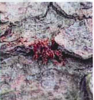
Drtiny na patě stromu.

Včasná asanace napadených stromů s využitím všech dostupných metod zabránění nebo omezení napadení dalších stromů a tím se vynaložené náklady vrátí. Je nutné brát v potaz omezení jednotlivých metod a zohlednit je pro konkrétní situaci.