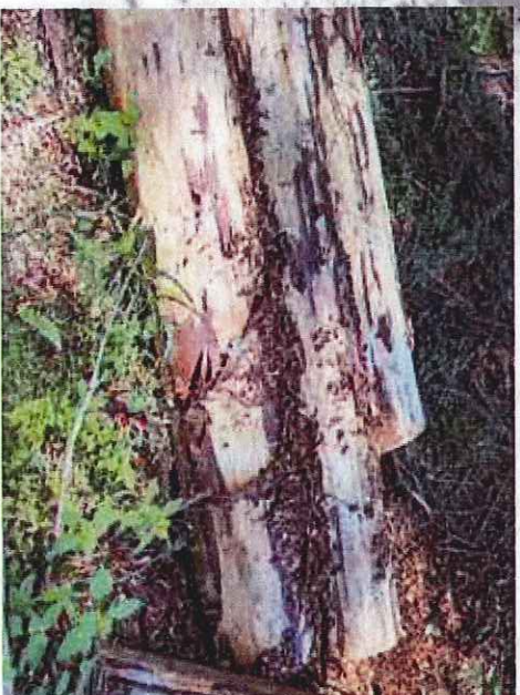
Asanace pomocí odkornění.

Ruční odkornění je velice účinné (nelze jej ale použít ve stádiu žlutého brouka s výjimkou odkorněvacích adaptérů na motorovou pilu). Oloupání kůry z pokáceného kmene v malém množství nevyžaduje pro fyzický zdravotní vlastník zásadní náklady, kromě investice do vlastního času a často je pro drobného vlastníka lesů jedinou dostupnou metodou. Chemická asanace nemá z hlediska vývoje stádia omezení, výkon je vyšší, ale pro drobného majitele lesa existují omezení v zajištění přípravků pro chemickou asanači. Alternativou je odkornění pomocí adaptérů na motorovou pilu, ale je třeba vlastnit pilu s odpovídajícími parametry.